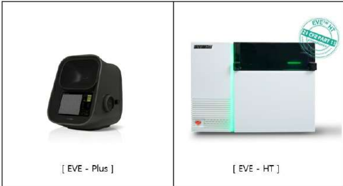
자동 세포 계수기 / 자동 멀티 세포 계수기

ADAM-MC는 형광 물질과 형광현미경의 원리를 이용하여 세포를 계수하는 기기이기 때문에 기본 구조가 복잡하고 제작비가 고가입니다. 이에 보다 저렴하고 휴대가 용이하며, 형광을 이용하지 않는 간단한 세포 계수기의 개발이 필요하다는 생각에 당사에서는 Countess라는 소형 세포 계수기를 개발하였습니다. Countess는 일반 광학현미경의 원리를 기반으로 한 제품으로 1회용 세포 계수 칩인 C-Chip을 이용하여 간편하게 자동화된 세포의 계수 및 세포의 생존율을 측정 할 수 있으며, 일반 실험실 탁자에 거치할 수 있는 소형의 장비로 세포 실험을 하는 실험실이면 어디든 사용이 가능하다는 장점이 있습니다. 현재는 EVE라는 제품명으로 판매하고 있습니다. 2019년 7월 새롭게 출시한 EVE Plus는 기존 검사시간을 25초에서 1초 이내로 단축하였으며, 특수 알고리즘 적용으로 소형 세포계수기에서 구현하기 힘든 뭉친세포의 카운팅에 최적의 성능을 갖추고 있습니다. 한편, EVE-HT는 자동 멀티 세포 계수기로, 최대 48개의 샘플을 단 3분만에 카운팅 할 수 있는 대용량 세포 계수기입니다. 또한 전용 소프트웨어는 생성된 데이터의 기록, 보안, 결재를 수행하며 cGMP 시설에 사용하기 위한 전자 기록 및 서명에 관한 규정인 21 CFR Part 11을 준수합니다. CFR Part 11 모드가 활성화되면 어떤 사용자도 데이터를 수정할 수 없으며, 장비 내에서 사용된 기능, 날짜 시간 등 사용자의 모든 작업은 추적 기록됩니다. 또한 생체 인식에 기반한 전자 서명은 다른 사람이 재 사용하거나 활용할 수 없도록 설계 되었습니다.