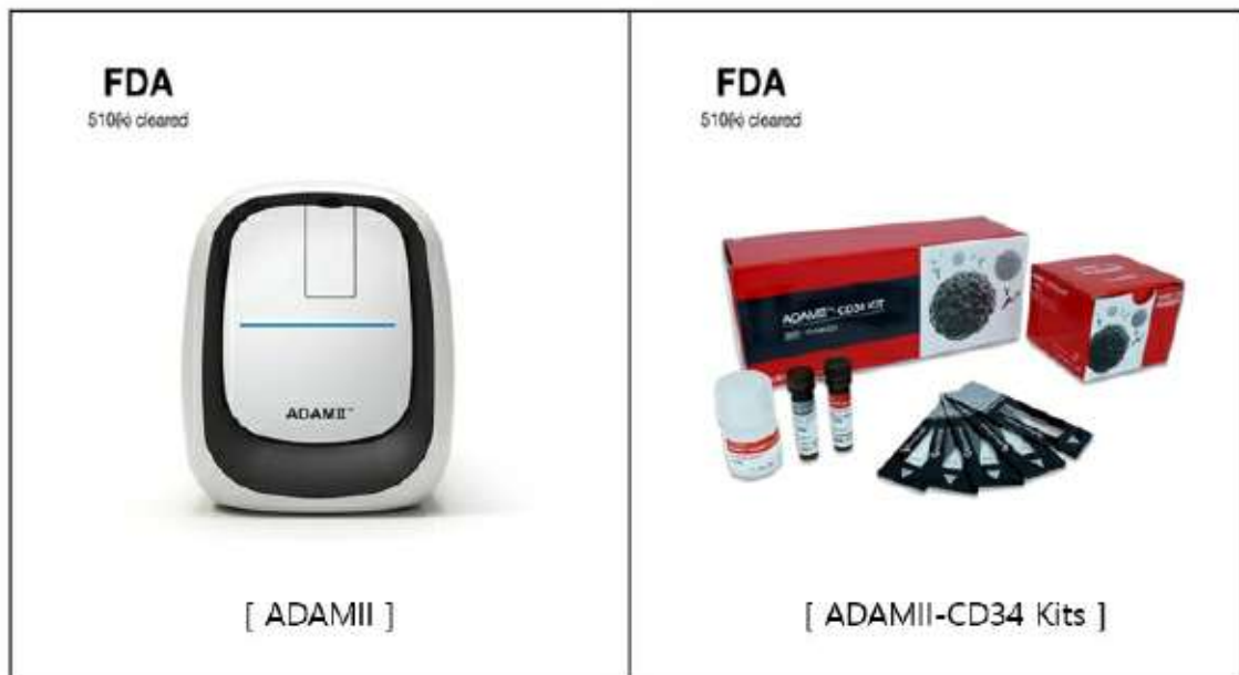
조혈모 줄기세포 자동계수 시스템

ADAMII-CD34는 백혈구 표면에 존재하는 CD34를 확인하여 CD34양성 백혈구(조혈모 줄기세포) 이식가능 시점 여부를 검정하는 장비입니다. ADAMII-CD34는 백혈구를 대상으로 하며, 형광염료를 이용한 세포 염색 및 세포계수를 실시하여 그 결과를 그래프화하고 데이터를 저장하는 일련의 반복적인 과정을 간편하게 수행할 수 있다. 그러므로 ADAMII-CD34는 이식 성공률을 높이기 위해 혈액 내에 조혈모 줄기세포의 양을 측정하여 줄기세포 이식 적정시점을 선정할 수 있는 데이터를 획득할 수 있습니다. 또한 ADAMII-CD34에 사용되는 일회용 micro-channel chip의 사용은 매뉴얼 측정에 사용되는 혈구계산판(Nageotte Counting Chamber)를 씻어 재 사용하