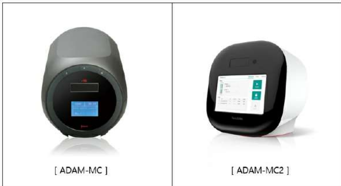
형광염색 자동 세포 계수기

세포의 계수는 생명과학뿐만 아니라 다양한 질병을 진단하는 의학에서도 아주 기초적인 실험으로 널리 행해지고 있습니다. 그러나 사람이 직접 계수하게 되면 어쩔 수 없이 오차가 발생하게 됩니다. 나노엔텍에서는 이를 해결하고 보다 빠르고 정확한 세포 계수를 위하여 자동 세포 계수기인 ADAM-MC를 개발하였습니다. ADAM-MC는 형광 물질로 세포핵을 염색하고 형광현미경 구조를 이용하여 세포의 형광 이미지를 얻은 다음, 이를 분석하여 정확한 세포의 계수가 가능합니다. 또한 기존의 기기들과는 차별되게 PMMA(Poly Methyl Meta Acrylate)를 이용한 간단한 1회용 칩에 샘플을 넣고 측정하기 때문에 사용하기 편리하며, 1회용 칩의 사용으로 유해한 샘플에