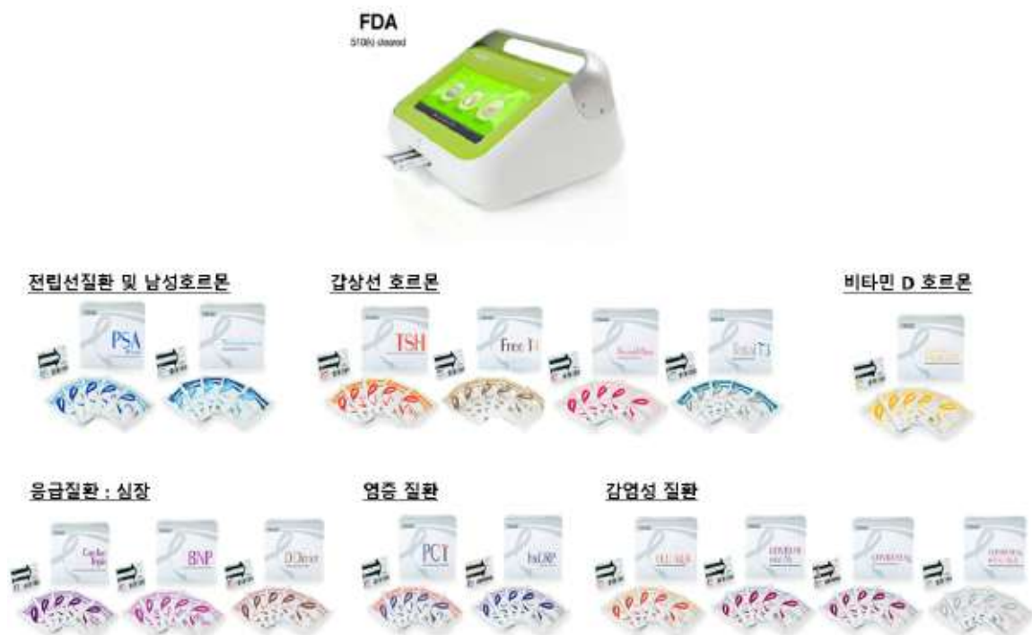
형광면역 현장진단 시스템

(1) FRENDS System (랩온어칩 기반 형광분석 면역 진단 시스템)