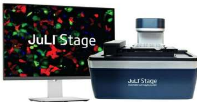
[ JuLi-Stage ]