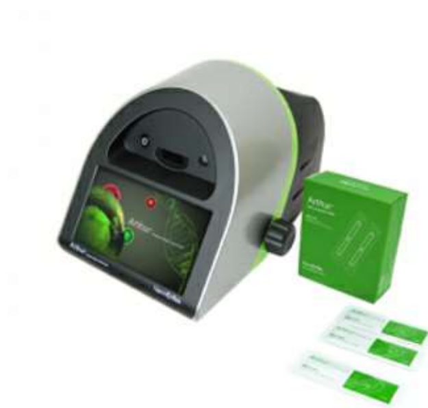
[ Arthur & Slide ]