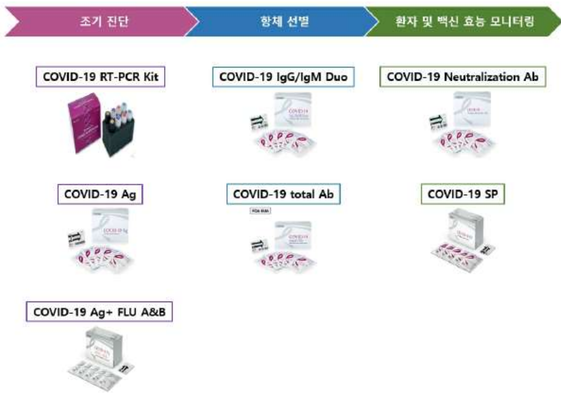
FREND COVID-19 Line-up